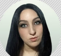
ALISON GLENN FOTOGRAFÍA