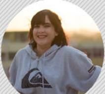
GÉNESIS PÉREZ DISEÑO Y FOTOGRAFÍA