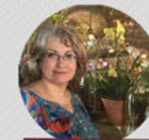
MARITZA PAZ EDICIÓN Y TRADUCCIÓN