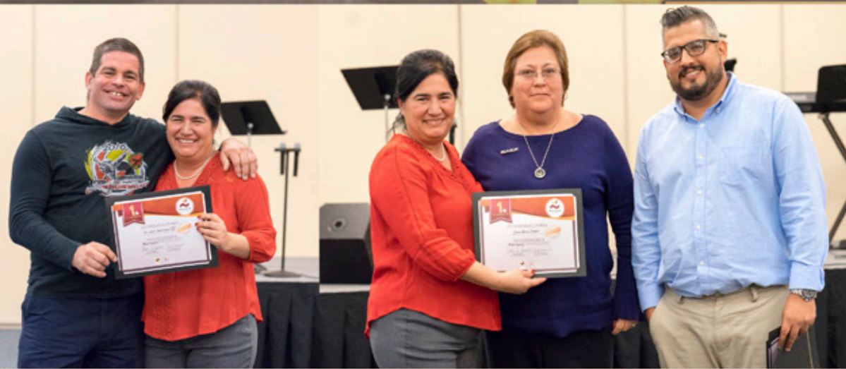
Daymar College, Don Pancho Mexican Restaurant First Baptist Church, Fun Accounting for Preschoolers