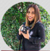
VANESSA ALMONTE FOTOGRAFÍA