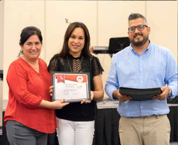
House Cleaning & Painting, Human Relation Commission, iPaint, J & R Painting Co.