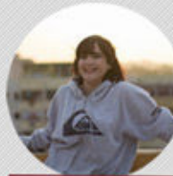
GÉNESIS PÉREZ DISEÑO Y FOTOGRAFÍA