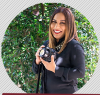
VANESSA ALMONTE FOTOGRAFÍA