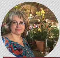
MARITZA PAZ EDICIÓN Y TRADUCCIÓN