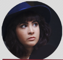
GÉNESIS PÉREZ DISEÑO Y FOTOGRAFÍA